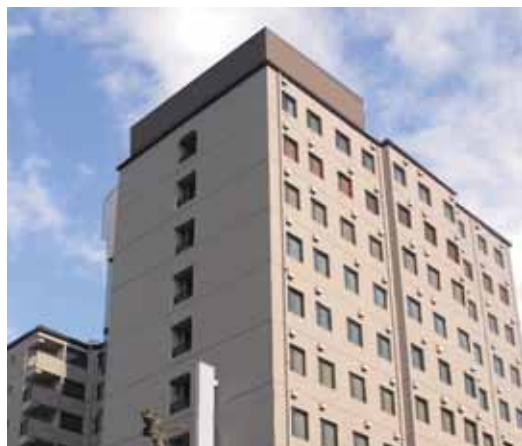
商品名：エコキュート 納入先：久留米市内某ホテル様