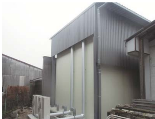
大川市 若波酒造様 低温倉庫

低温倉庫で、生産に季節性がある商品の長期間保存が可能になると、市場に安定供給ができるため、価格も安定し、その結果消費量が伸びるといふ大きなメリットがあります。