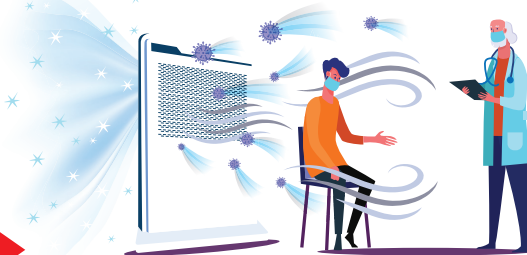
ウイルスガードウォール 患者 医者